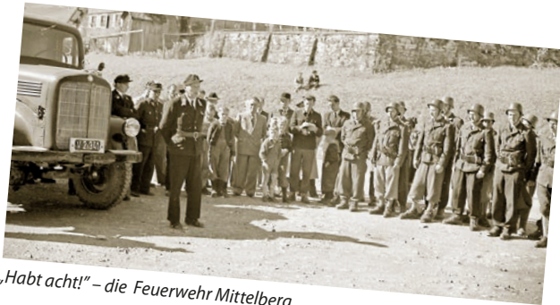
„Habt acht!“ – die Feuerwehr Mittelberg.