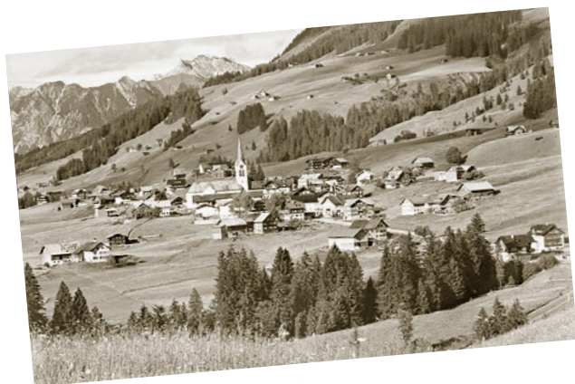
Als Riezlern noch etwas kleiner war.