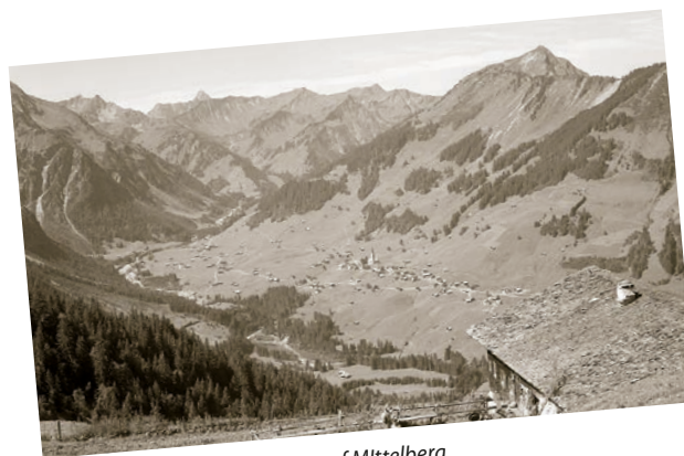
Blick von der Kuhgehrenhütte auf Mittelberg.