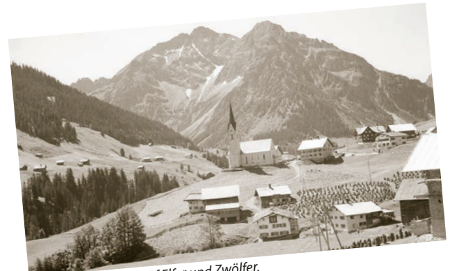
Hirschegg mit Blick auf Elfer und Zwölfer.