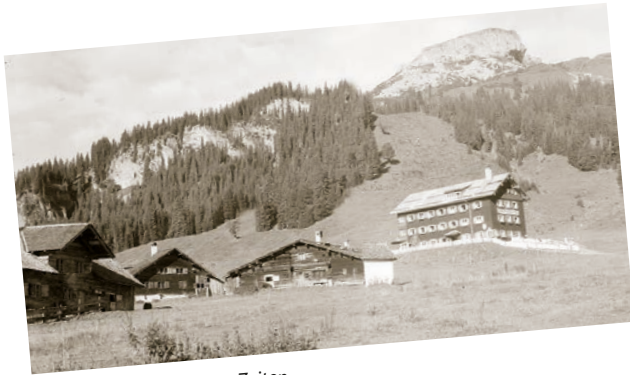
Die Auenhütte in alten Zeiten.