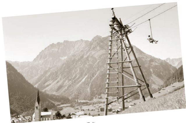
Der Zaferna-Lift zur damaligen Zeit.