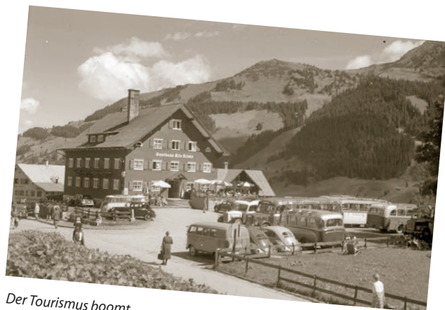
Der Tourismus boomt...