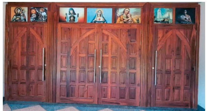
Das Bild wird über dem Hochaltar angebracht. Über den Kirchentüren sind Glasfenster mit Bildern von jeder kleinen Basisgemeinde von Kisangara Juu.