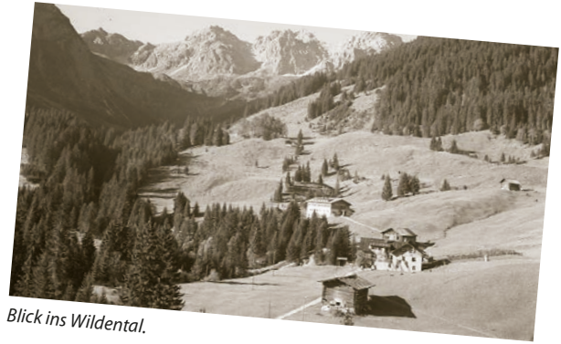
Blick ins Wildental.