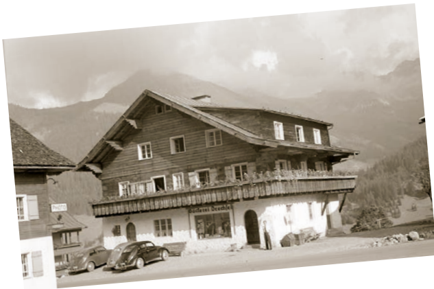
Die Bäckerei Drechsel in Mittelberg