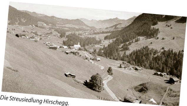
Die Streusiedlung Hirscheegg.