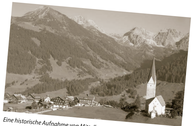
Eine historische Aufnahme von Mittelberg.