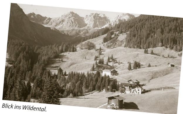
Blick ins Wildental.